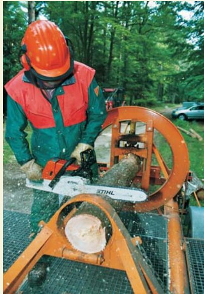
Bild oben links: Der Kolben drückt von oben auf den Baumstamm. Erst wird in die Druckseite gesägt, danach in die Zugseite.

Das brechende Holz findet in den Aufnahmevorrichtungen ausreichend Halt, um die auftretenden Kräfte und physikalischen Abläufe beim Sägen zu veranschaulichen. Der Mitarbeiter steht dabei sicher neben dem Stamm und ist vor der Bewegung des Holzes beim Bruch geschützt. So kann jeder einzelne Mitarbeiter beliebig viele Stämme sägen und Erfahrungen in den verschiedenen Situationen sammeln.