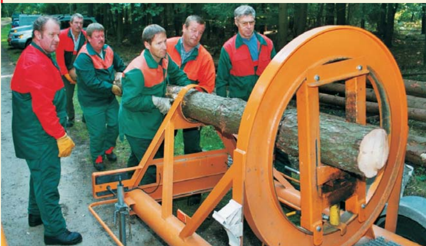
Bild oben: Die Baumstämme sollten eine Länge zwischen 4 und 7,50 m und einen Durchmesser bis zu 24 cm haben. So sind mehrere Schnitte möglich.