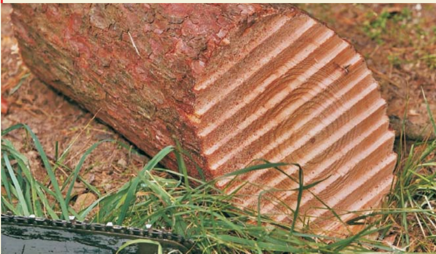
Bild oben: Der sogenannte Treppenschnitt wird benutzt, um unter Spannung stehende Baumstämme zu sägen, die nur von einer Seite zugänglich sind.